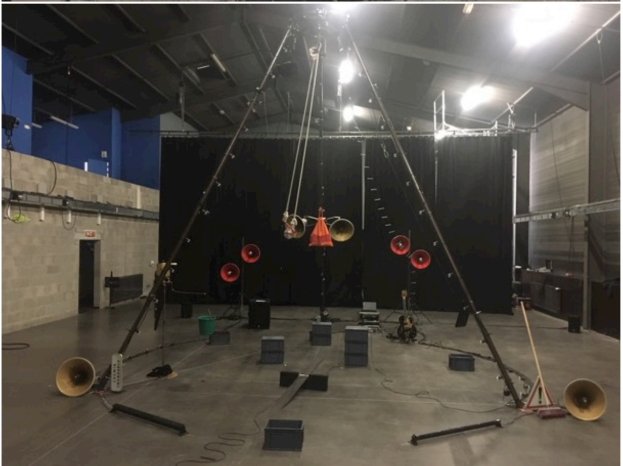
Fiche technique Le Silence Dans L'Echo, Cie Le Passager-Cirk Vost